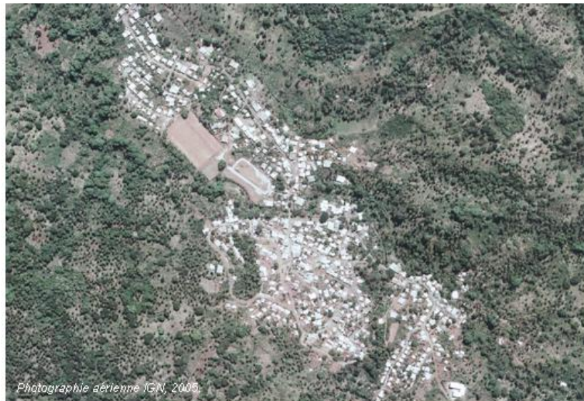
Photographie aérienne IGN, 2006